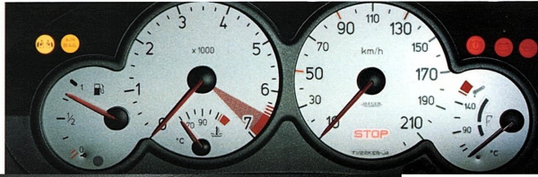
Fond de combiné gris argent.