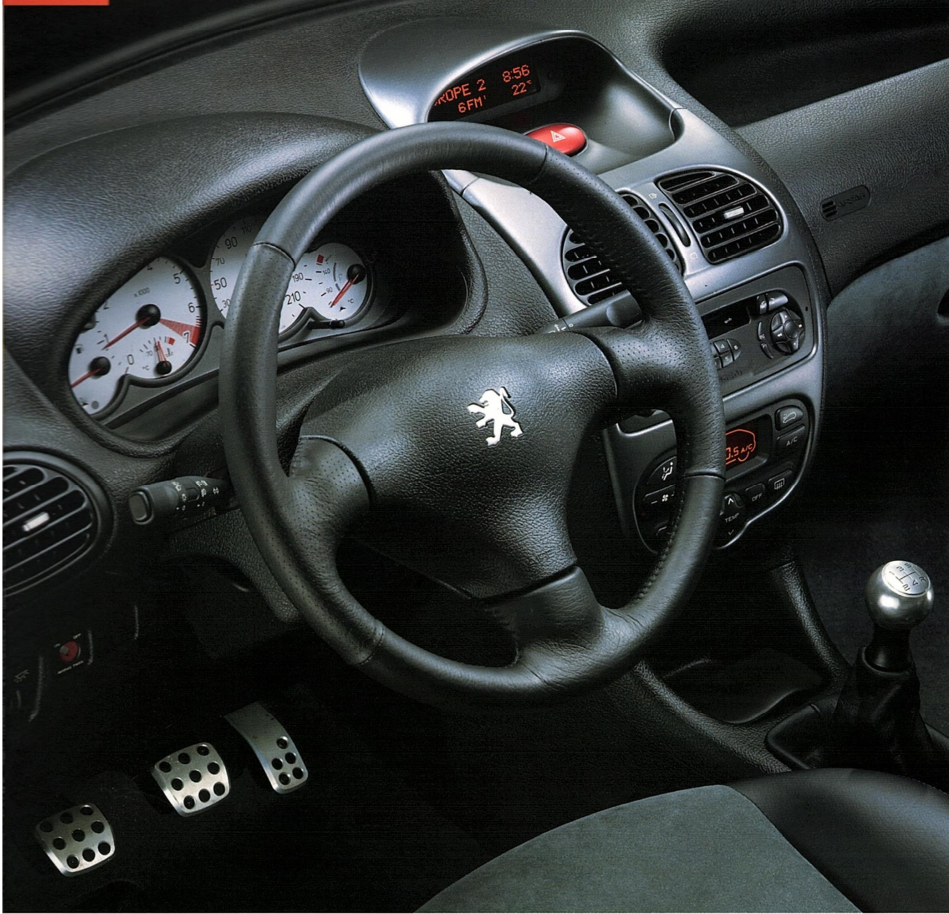
Design intérieur aluminium pour la façade technique, le pommeau de levier de vitesses et le pédalier.