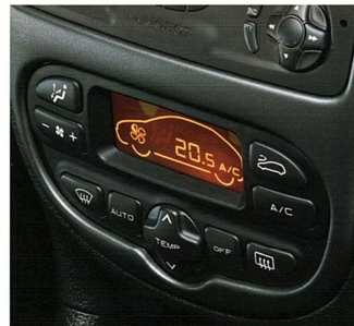
Air conditionné à régulation automatique et façade digitale.

Ils seront des millions à voir courir la 206 WRC