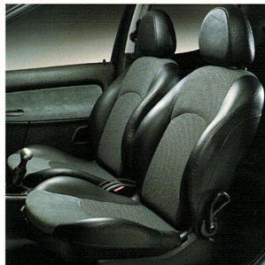
Sièges sport habillés de cuir/Alcantara/tissu tressé.