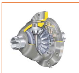
Différentiel à glissement limité