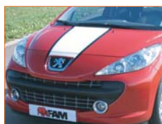
Décoration de capot