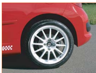
Jantes F-Racing 17"