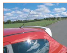
Becquet et Coques de rétroviseurs assorties