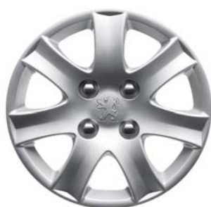
Enjoliveur SPA 14"