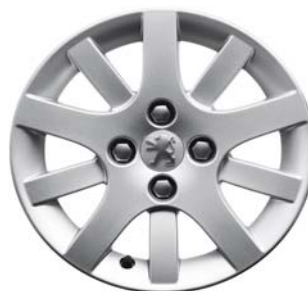
Jante Interlagos 15"